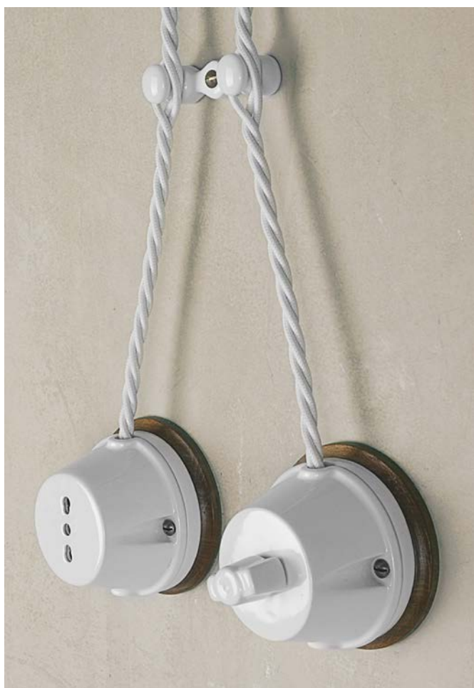
Art. LAR.191.00 Art. LAR.134.A Art. LAR.134.A Art. LAR.132.00 Art. LAR.190.00 Art. LAR.138.02